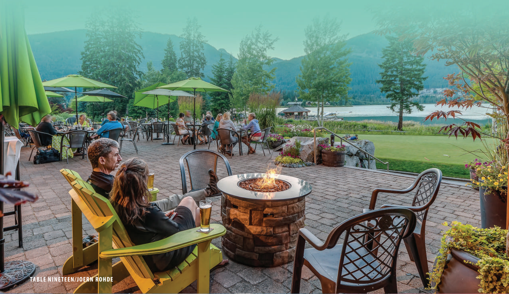
TABLE NINETEEN/JOERN ROHDE